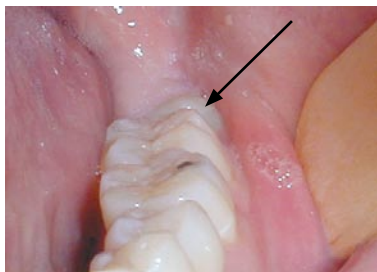
Bagest kan visdomstanden lige skimtes

Oftte er der kun plads til, at en del af visdomstanden bryder frem i munden. Såfremt den delvist frembrudte visdomstand ikke gør skade, er der ingen grund til at fjerne den.