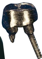
Nu er tanden blevet så stærk, at den kan bære en krone